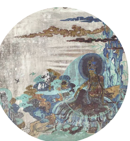
榆林2窟南壁水月观音

(290、428、299等窟)通常为大型本生及佛法故事连环画,皆以白壁为底,用流暢的线描勾勒,造型简练生动,色彩清淡雅丽,虽有肌肤略作立体晕染,尚存西域绘画遗风,但整体而言,从形象到艺术风格已是汉族传统绘画面貌了。