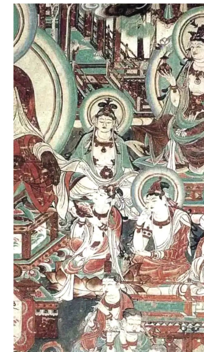
榆林25窟南壁乐舞图