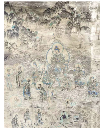
榆林3窟西壁北面文殊变风格

敦煌壁画泛指存在于敦煌石窟中的壁画。敦煌壁画包括敦煌莫高窟、西千佛洞、安西榆林窟共有石窟552个,有历代壁画五万多平方米,是中国也是世界壁画最多的石窟群,内容非常丰富。敦煌壁画是敦煌艺术的重要组成部分,规模巨大,技艺精湛。敦煌壁画的内容丰富多彩,它和别的宗教艺术一样,是描写神的形象、神的活动、神与神的关系、神与人的关系以寄托人们善良的愿望,安顿人们心灵的艺术。因此,壁画的风格,具有与世俗绘画不同的特征。但是,任何艺术都源于现实生活,任何艺术都有它的民族传统;因而它们的形式多出于共同的艺术语言和表现技巧,具有共同的民族风格。著名的敦煌壁画有九色鹿救人、释迦牟尼传记、萨埵那舍身饲虎等著名的壁画故事。