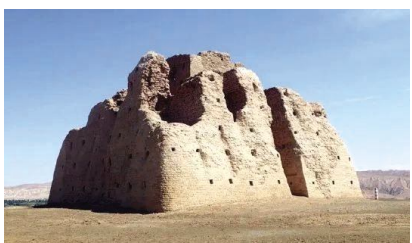
新疆鄯善县连木沁大墩唐烽燧遗址。张依萌 摄