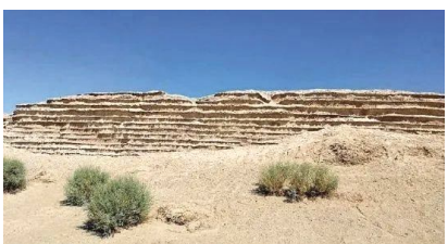
甘肃敦煌汉长城。

今天，长城保护坚持预防为主、原状保护的原则，保存住各时代遗迹，将古长城修复一新乃至重建、新建的做法已被明令禁止。“有些人一看到原始长城的残垣断壁，就抱怨这些破石头堆怎么不修复、不重视。现在就是要保存长城的沧桑古朴，不去过分干预，这个理念要不厌其