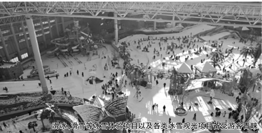
滑冰、滑雪等冰雪体验项目以及各类冰雪观光项目备受游客青睐

丝绸之路迎新朋，研学旅行正当时。 初冬时节，五凉古都武威迎来了一场研学盛会。11月13日至16日，由甘肃省文化和旅游厅主办、武威市文化和旅游局承办的“旅行丝绸之路·研学在甘肃”2024甘肃研学旅行大会在武威举行，重点研学机构、基地、学校和研学旅行渠道商齐聚一堂，共赏山水人文，共叙合作友情，共谋研学未来。 13日大会开始前，各市(州)展示区的非遗课程、青少年夏令营等丰富多彩、形式多样的研学活动引得来宾纷纷上前询问。 非物文化遗产是一部百科全书，常看常新。“非遗+研学”的方式也为非遗注入了新的活力。“白银市目前发现了21处岩画，我们组织学生去临摹岩画，更好地了解岩画的历史价值和艺术价值。”白银市博物馆宣教部负责人一边介绍一边向记者展示学生们的临摹作品。 丝绸之路在甘肃绵延1600多公里，如串珍珠般串起了一座座历史文化名城。如今，古丝绸之路焕发出新的光芒。博物馆展陈的文物，讲述着古老的故事；脍炙人口的诗篇，在一声声诵读中流传；一个个关隘烽燧，虽经千年风霜侵蚀，依然屹立在荒漠戈壁之中…… “火星一号基地，让探索不再孤独；火星一号基地，从这里走向未来”“研学凉州，感受知识与情感的交融”…… 台上，来自金昌、武威、敦煌等地的研学推介官结合丰硕的研学成果侃侃而谈；台下，嘉宾们记录着各有价值的研学线路，相互交流着对研学资源、研学课程、研学线路的体验、感受、理解与期待。 天津国旅海外国际旅行社有限公司相关负责人说，今天印象最深的是有关丝绸之路的推介。我们计划深度挖掘不同年龄段孩子们的研学需求，围绕“丝绸之路”把研学做得更有深度，将文化和研学结合起来，再同当地旅行社加强合作，携手发展。 在“学”字上下功夫，在“旅”字上做文章。本届大会聚焦研学旅行新模式、新发展和行业新趋势，如何让组织形式更有创意，如何更好地呈现甘肃研学旅行的千堂研学课程，给出了精彩答案——这是一场甘肃研学旅行精品课程的实景演绎。演出选取了“简·述甘肃”“彩陶记忆”“词忆凉州”等5堂最具代表性、典型性的课程，通过创新编排、数字表现和虚实结合，具象化、场景化地将课程搬到会场、搬上舞台。 演员们有的身着“彩陶”“简牍”的服装，以第一人称视角进行自我介绍；“牛肉面师傅”也把锅碗瓢盆搬上了舞台……现场嘉宾在互动课堂中“身临其境”地体验了甘肃研学课程的生动有趣，直观感受了甘肃丰富的研学资源、专业的研学课程和优质的研学环境。“今天切实感受到了甘肃旅游资源之丰富，领略了西北之美。”康辉集团北京教育科技有限公司相关负责人说，“从历史文化到爱国主义教育，甘肃的研学资源也很丰富。我们将带着研学团队和课程设计师团队再来甘肃，专门规划、设计与校本课程相关联的研学产品，向全国推广。” 大家纷纷表示，这样的研学推介，有料有趣；这样的研学课程，爱听爱看。“围绕河西走廊我们推出的亲子营和孩子独立营两款研学产品，在2024年暑假都成了新东方文旅的大爆款。”新东方沃凯德(甘肃)文旅有限公司工作人员告诉记者，此次研学大会，让自己眼界大开；同行更是深有同感：甘肃是文旅发展和研学旅行的一片沃土，大家都有信心再把天水、平凉、庆阳的研学旅行路线做好。沉浸式的研学课程带领大家走进气象万千的浩瀚世界，“学”和“游”在甘肃不断焕发出勃勃生机，“研学+”不断为文旅融合注入澎湃动能，甘肃研学品牌在不断创新出彩。 (吴涵)