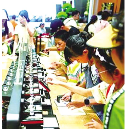
游客在湖南博物院博物馆公园体验文创产品。

1953年,当时的文化部颁布《关于整顿和加强文化馆、站工作的指示》,明确了文化馆(站)开展群众文化工作、活跃群众文化生活的职能,国家公共文化服务体系建设由此启动。此后几十年,公共文化机构的设施建设、设备条件逐步改善。