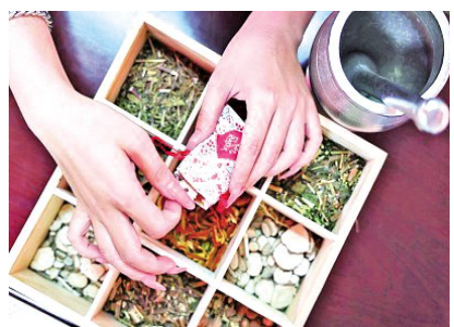
山东临沂,市民体验制作中药香囊。