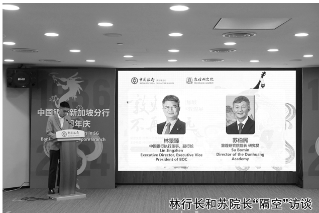
林行长和苏院长“隔空”访谈