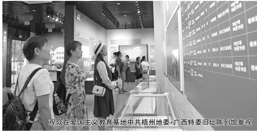
观众在爱国主义教育基地中共梧州地委-广西特委旧址陈列馆参观

湖南醴陵,2024湖南(醴陵)国际陶瓷产业博览会推出了3个大类18个主题活动,丰富游客的体验;山东枣庄冠