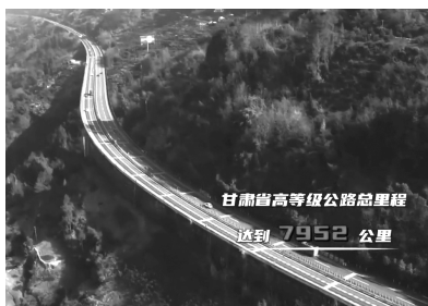
甘肃高速公路总里程达到7952公里

功能定位，坚持重在保护、要在治理，坚决担好上游责任，彰显上游作为，切实筑牢国家西部生态安全屏障。2023年，甘肃省黄河流域41个国家断面水质优良比例达到92.68%，高出黄河流域平均水平2个百分点，黄河干流出境断面水质连续8年达到Ⅱ类，实现了“一河清水送下游”。