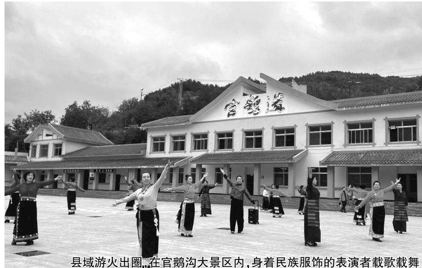
县域游火出圈，在官鹅沟大景区内，身着民族服饰的表演者载歌载舞

今年国庆假期，甘肃一些县域凭借独特风情、雅致环境、文化“加成”，成为游客避免扎堆、个性化旅游的优先选项。“非著名”县域游热度十足，彰显出县域文旅市场的生机和活力。