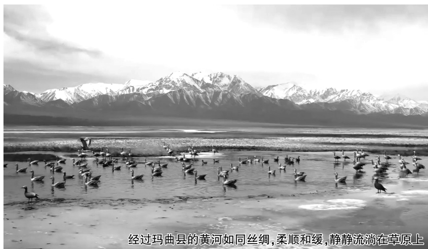
经过玛曲县的黄河如同丝绸，柔顺和缓，静静流淌在草原上