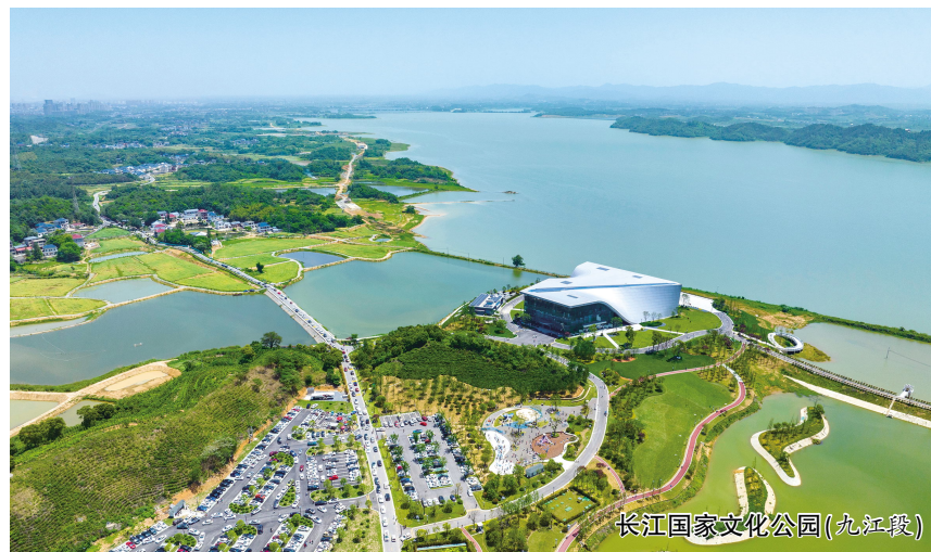
长江国家文化公园(九江段)

九江市坐拥江西省内全部152公里长江岸线,秉承“还江于民、便民利民、生态优先、文化铸魂”原则,九江市在建设长江国家文化公园(九江段)中注重长江文化保护传承工作,使堤内的琵琶亭、浔阳楼等古建筑与周边景点相得益彰