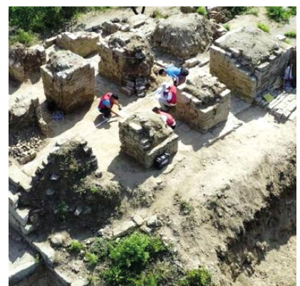
大庄科长城研究性修缮

长江作为中华民族的重要发源地,孕育了流经地区多姿多彩的地域文化。在推动建设长江国家文化公园的进程中,13个沿线省市区深入挖掘长江文化内涵与时代价值,充分彰显地方文化特色,促进文旅融合,让长江文化保护和文物资源展现出新的时代活力。