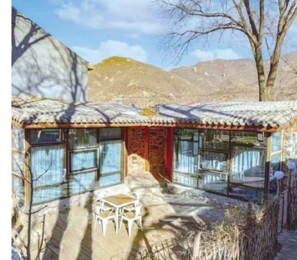
北京市延庆区石光长城民宿

连续五年成功举办北京长城文化节,成为北京市长城文化首要节庆品牌。依托文化节宣传展示长城文化符号,推出学术论坛、展览展示、创意大赛、实景演出、体育活动、民宿旅游等一系列活动,倡导公众参与、形成传播热潮。2023年文化节主场活动与杭州亚运会开幕时间重叠,仍然登上当日微博热搜新闻榜首,当日累计话题点击量超过11亿次。2024北京长城文化节以“群众性、文化性、时代性”为核心理念,采用“1+5+N”的多元化活动模式进行组织,包括一场