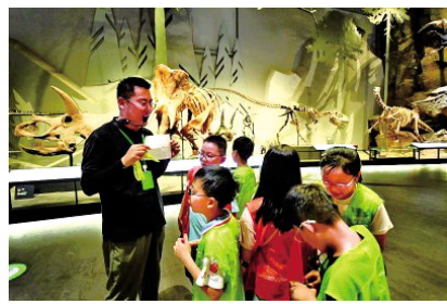
暑假期间,浙江自然博物院安吉馆开启夜游项目,图为带队老师向孩子们介绍夜游规则。

个花车摊位、12辆餐车餐位、8个集装箱有序排列,分别组成了美食区、文创区和游乐区。市民不仅可以在此品尝特色美食,还能享受购物和带娃游玩的乐趣。