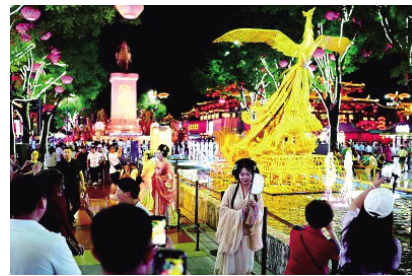
游客在陕西西安大唐不夜城景区游览。

“大众需要实体餐饮的宵夜,也需要精神文化的‘深夜食堂’。”戴斌指出,除了众所周知的夜市和专场演出,应当继续深入挖掘夜游的文化潜力。