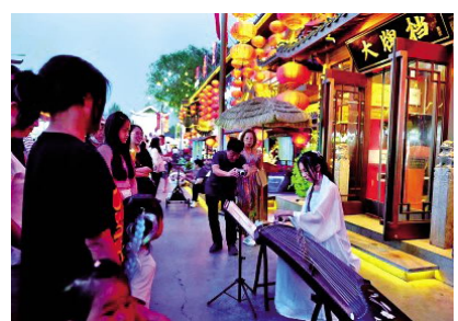
演员在河北秦皇岛皇小巷文化美食旅游街区为游客弹奏古筝。