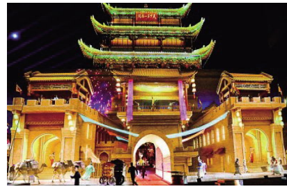
在甘肃嘉峪关关城景区拍摄的夜游灯光剧《天下嘉峪关》光影效果。

造景应有脉、有根、有源。业内专家指出,现在夜游场景开发已有雷同化倾向,让更多游客觉得“似曾相识”。数字硬科技需要与文化软实力相结合,各地应系统梳理并充分挖掘当地优秀历史文化,强调夜游项目的主题性、故事性、文化根植性。