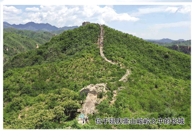
位于延庆崇山峻岭之中的长城

价值研究是长城国家文化公园建设的重要基础工程，是文化遗产保护传承的基础。2023年，北建大师生完成了《长城国家文化公园建设重要问题研究——古北口长城历史文化价值研究》。该研究从北京长城价值再辨析，古北口长城历史及重头故事、古北口长城