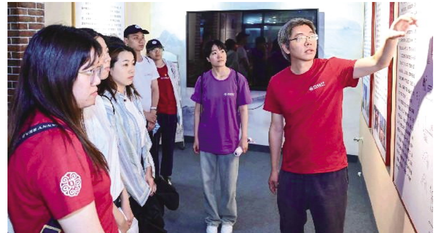
北京建筑大学将“再上一堂思政课”讲台搬到长城保护一线石峡村