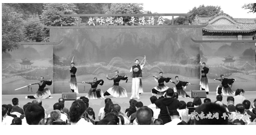
武咏崆峒 平凉诗会

平凉诗会在开场曲《崆峒引》中拉开帷幕，在古雅悠扬的古琴声中，人们仿佛来到了黄帝问道广成子的情境之