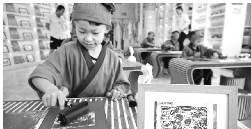
暑假期间，位于青岛栈桥书店的印象国风艺术馆举行拓印研学活动，吸引学生前来学习、体验。

此外，一些研学旅行保障不足，存在安全隐患。江苏省消保委此前所做的一项问卷调查结果显示，近两成的消费者认为研学旅行的安全保障不到位；安全