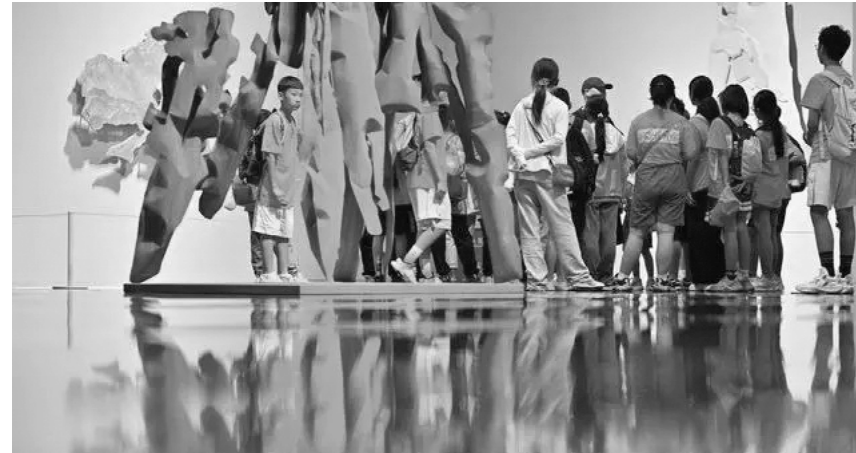
7月24日，参加研学的学生在清华大学艺术博物馆参观。