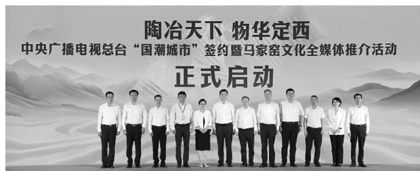
陶冶天下 物华定西 中央广播电视总台“国潮城市”签约暨马家窑文化全媒体推介活动 正式启动