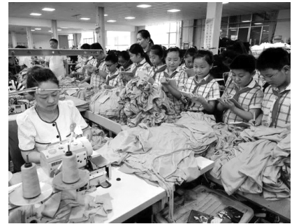
7月28日，在山东省枣庄市滕州一家纺织服装企业的成衣车间，参加研学活动的小学生们在了解服装生产过程。新华社记者 孙中喆 摄