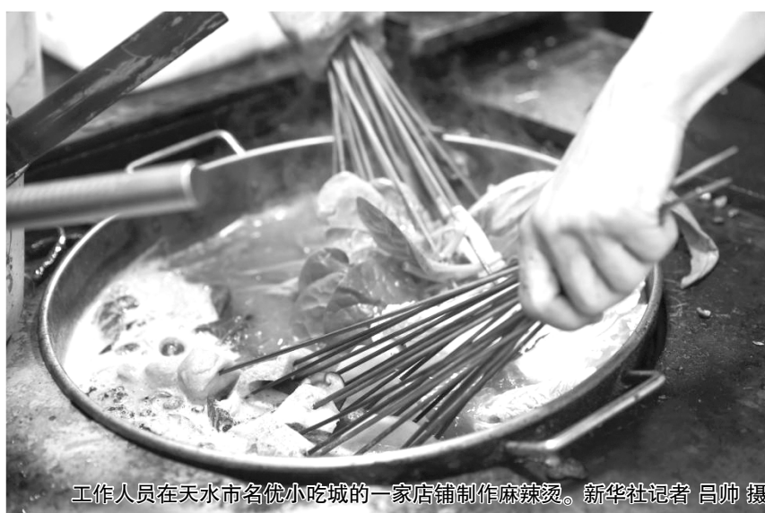
工作人员在天水市名优小吃城的一家店铺制作麻辣烫。

“从拿到有关行政许可审批，到生产线投入运营，前后不到1个月时间。”天水绿垦农业开发有限公司负责人戚卫红说，今年3月天水麻辣烫火爆后，他嗅到商机，投入了一条速食麻辣烫生产线，到