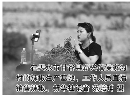
在天水市甘谷县新兴镇侯家沟村的辣椒生产基地，工作人员直播销售辣椒。