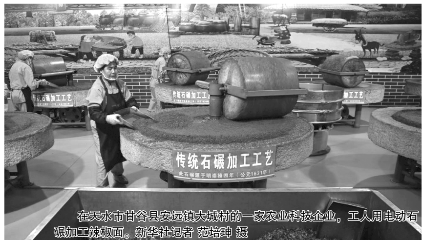
在天水市甘谷县安远镇大城村的一家农业科技型企业，工人用电动石碾加工辣椒面。