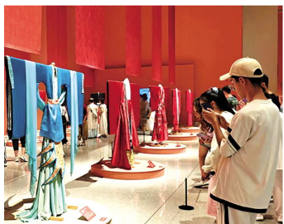
游客正在参观“五彩锦簇——中华服饰文化展”

在河北廊坊,“只有红楼梦·戏剧幻城”打破传统戏剧演出的模式,融合情景装置艺术与舞台沉浸技术,为游客带来全新体验。通过剧场和情境空间的展演展示,戏剧幻城拓展出更多产品与业态,与廊坊丝绸之路国际艺术交流中心、水云间文化商街等联动,延伸形成文旅综合体。