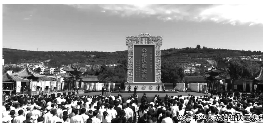
公祭中华人文始祖伏羲大典

一座城市,有历史才有底蕴,有文化才有内涵。伏羲文化在天水人发自内心的研究和挖掘中,在中华儿女一年一度的寻根共祭中传承至今,不断壮大。伏羲及其部族所开创的人文精神,塑造了中华民族,并成为中华民族、中华文明与中华文化绵延壮大,历经磨难与考验而不断复兴并充满生命活力的基因密码和力量之源。新时代新征程,伏羲文化将在铸牢中华民族共同体意识,实现中华民族伟大复兴和开创美好未来的征程中焕发出更为绚烂的光彩。