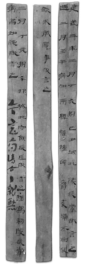
建武三年隄长病书