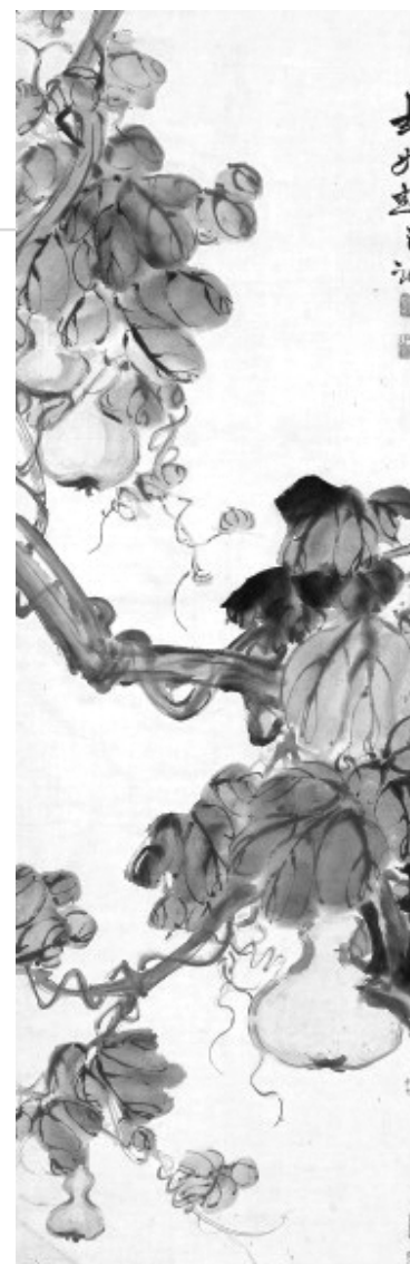
葫芦图(中国画)赵之谦