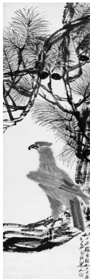
松鹰图(中国画)齐白石