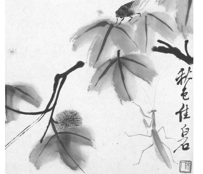
可惜无声 花草昆虫册页之十(国画) 齐白石 龙美术馆藏