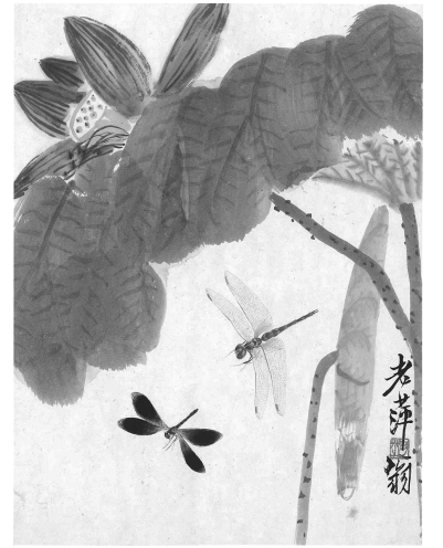
可惜无声 花草昆虫册页之四(国画) 齐白石 龙美术馆藏

南，游历中国。在这个过程中，齐白石结识了许多志同道合的艺术家和文人墨客，他们互相切磋技艺，交流心得。这让齐白石的艺术视野更加开阔，绘画技艺也得到了进一步的提升。