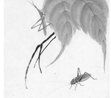
可惜无声 花草昆虫册页之七(国画) 齐白石 龙美术馆藏