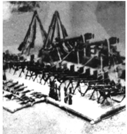
“泰顺攻城打援战斗”中缴获的部分武器