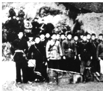
参加“泰顺攻城打援战斗”的部分指战员

战的假象，并引诱附近县敌人部队前来救援。第一支队遂向泰顺县城敌人北碛发动佯攻，攻城部队主动撤出县城，退往城郊毛垵坪休整。22日，我军在泰顺南山岭头、南浦吴山等地全歼了从文成县前来救援的敌军一个加强营的兵力，取得“泰顺攻城打援战斗”重大胜利。这次战斗，是浙南游击纵队创建以来首次攻占县城并歼敌一个整营的大胜仗。浙南游击纵队司令部曾给予高度评价：“泰顺战役乃我浙南武装斗争发动以来之空前大胜利，并为我浙南解放战争中攻坚战、歼灭战及连续作战之最好范例。”为此，中共华东局和中共闽浙赣区委还发来嘉奖。