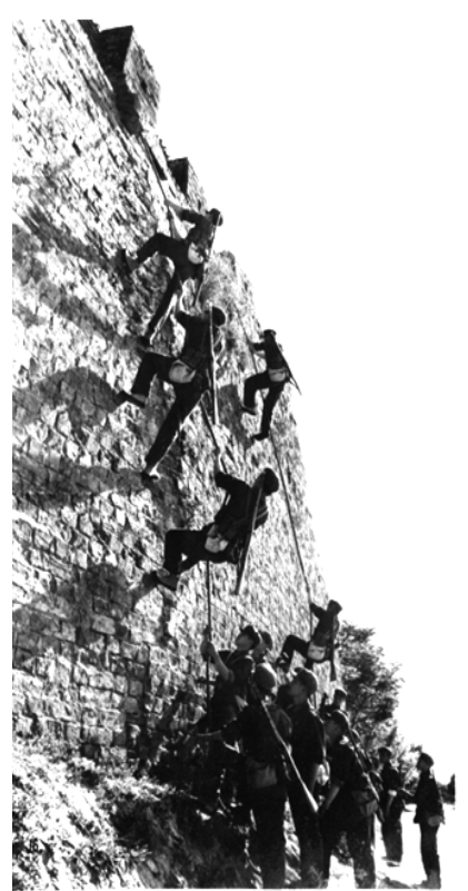
1949年2月17日至18日泰顺攻城战斗模拟场景（摄于1950年）

2024年是温州和平解放75周年。1949年2月中旬，浙南游击纵队首次组织攻打敌军县城的军事行动，即“泰顺攻城战斗”。此战的胜利，揭开了浙南人民武装利用全国解放的大好形势、依靠自身力量提前解放浙南的历史序幕。浙江省档案馆保留着两份敌军当时的求救电报，见证了泰顺攻城战斗的历史情形。