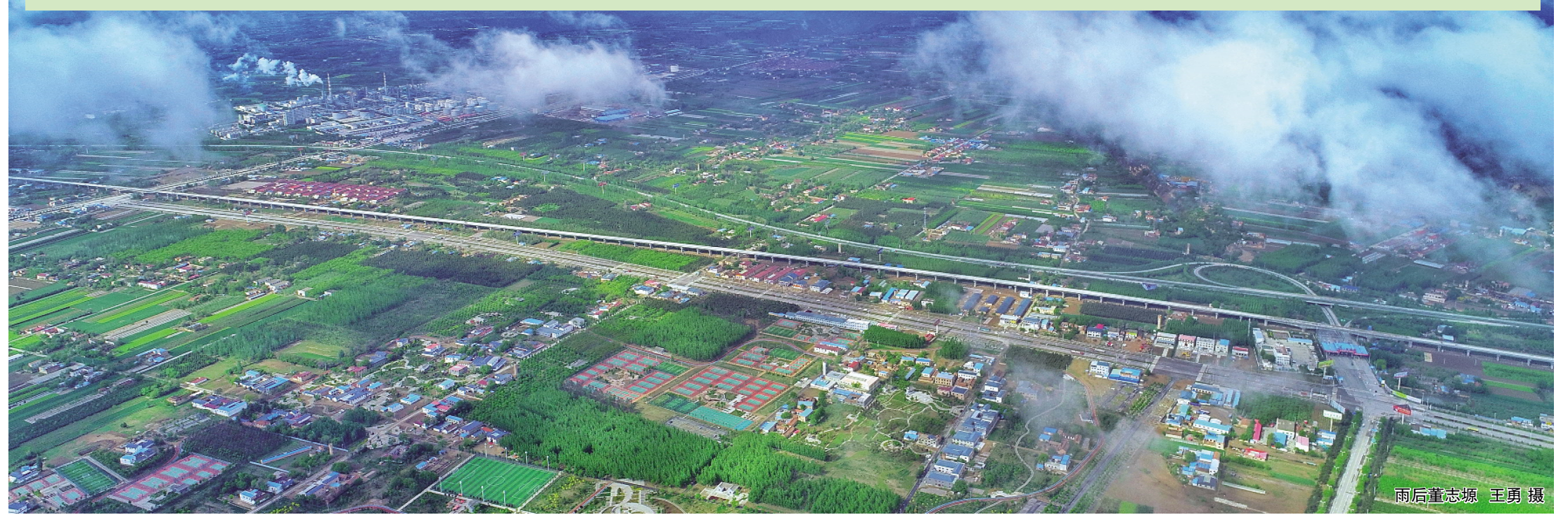
雨后董志塬