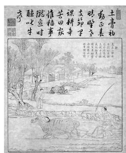
《御制耕织图》耕图之“耕”

比如,“耕”图画面之上,农人一手扶着曲辕犁,一手挥鞭赶牛。曲辕犁是古代中国十分重要的耕作农具,可以碎开板结的土壤,利于后期播种。画上题诗:“东皋一犁雨,布谷初催耕。绿野暗春晓,鸟铳苦肩膊。我徇劝农字,杖策东郊行。永怀历山下,法事关圣情。”此诗表达了对农事艰辛的感慨和同情,以及劝课农桑的主旨。另一幅表现织布场景的“经”图,描绘了三位农妇正在整理经线的场景,此图对整理工具刻画极为精细,对篱笆、院落、农