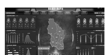
陇东能源大数据平台功能示意图