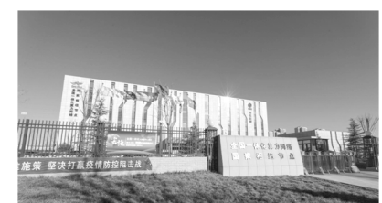
全国一体化算力网络 国家枢纽节点、金山云西北总部、东数西算庆阳基地