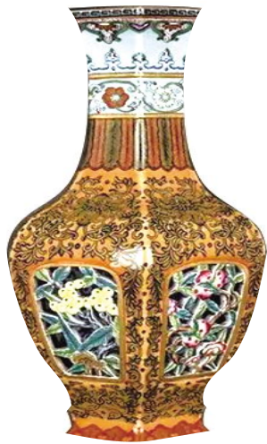
清乾隆款景德镇窑外粉彩内青花镂空花果纹六方套瓶

沿线50余处水闸、桥梁、堤岸、河道等古建筑、古遗址得到修缮保护,水体得到治理,古运河焕发了新的光彩。