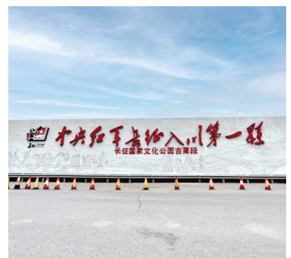
长征国家文化公园古蔺段

造项目、四川长征干部学院泸州四渡赤水分院古蔺教学点等20个重点项目建设。举办“赤水河之声”音乐节等5大主题红色文化交流活动,推出《四渡赤水在古蔺》《赤水河上的密电码》等文艺精品。