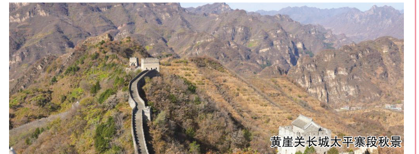
黄崖关长城太平寨段秋景