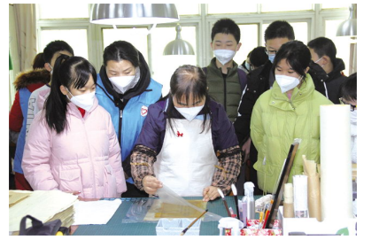
“我是小小古籍修复师”志愿服务活动现场

下一步,甘肃省图书馆将持续开展此项活动,让更多的青少年了解古籍、走近古籍,传承传统技艺,增强文化自信,促进中华优秀传统文化可持续发展。