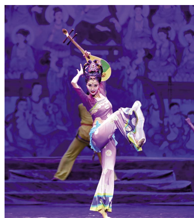
大年初二晚，经典舞剧《丝路花雨》在国家大剧院精彩演出，为首都观众送去新春佳节的美好祝福。

1月23日晚，甘肃省歌舞剧院携经典舞剧《丝路花雨》，继2009年、2011年之后，第三次登上中国表演艺术最高殿堂国家大剧院歌剧院，用一场精彩绝伦的艺术盛宴，拉开了2023年国家大剧院新春演出季的序幕，向首都各界群众送上新春的祝福。