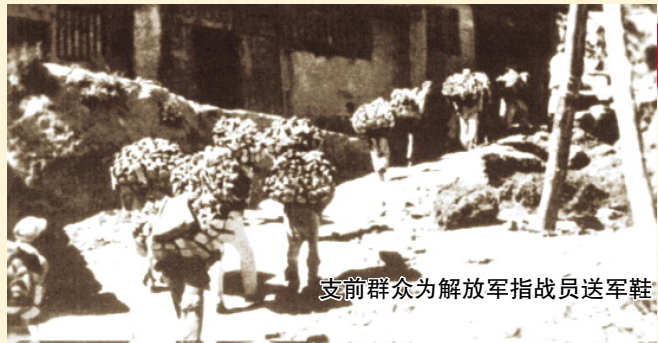
支前群众为解放军指战员送军鞋

做军鞋、担架运输是支前工作中一项大量的、经常性的任务。解放军的鞋袜,消耗量大,全靠发动老百姓制作,保障供给。当时做军鞋的办法是,由县政府下达任务,按任务发给相