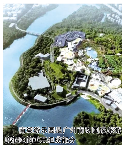
南湖游乐园是广州南湖国家旅游度假区的重要组成部分

据悉，2023年文化和旅游部将加大力度丰富优质产品和服务供给，加快推进旅游业振兴发展。包括：有序开展5A级旅游景区、国家级旅游度假区等评定复核。推进全国旅游资源普查，推出第一批中国特品级旅游资源名录。统筹推进长城、大运河、长征、黄河、长江国家文化公园建设。实施美好生活度假休闲工程，推出一批国家级旅游休闲城市和街区，培育一批乡村旅游集聚区，优化全国乡村旅游重点村镇和“乡村四时好风光”全国乡村旅游精品线路。