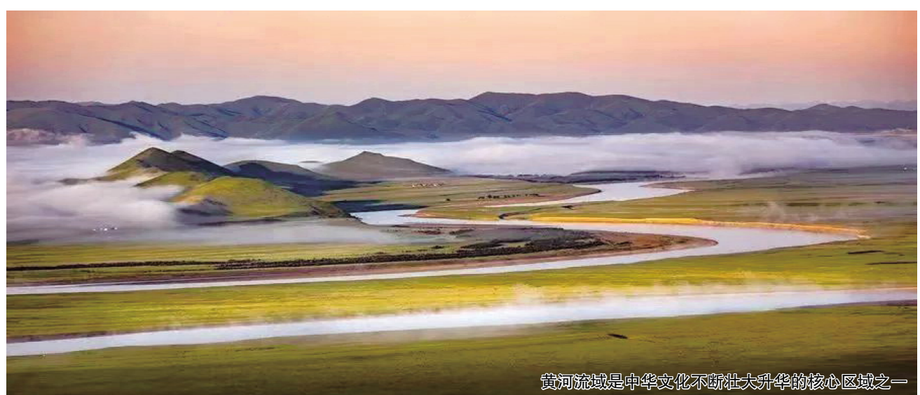
黄河流域是中华文化不断壮大的核心区域之一

2022年3月30日，文化和旅游部在线上举行的新闻发布会上表示，今年将开展中国特品级旅游资源名录建设工作。新闻发言人张旭霞表示，建设中国特品级旅游资源名录，有利于全面摸清优质旅游资源家底，有利于引导高等级旅游景区产品开发建设，有利于推动旅游资源普查工作全面深入开展。推进全国旅游资源普查，推出一批中国特品级旅游资源名录，这一项工作也被明确列入2023年工作要点。(综合)