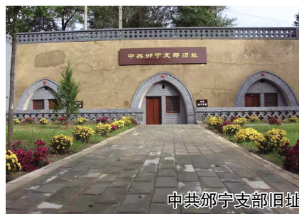
中共邵宁支部旧址