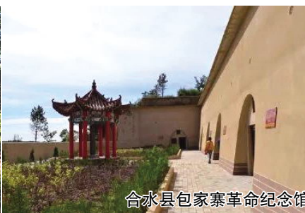
合水县包家寨革命纪念馆