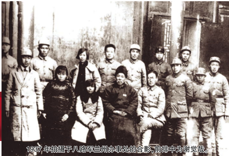
1937年拍摄于八路军兰州办事处的合影，前排中为谢觉哉。